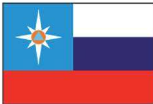
Представительский флаг МЧС России

19 ноября 1991 года был преобразован в Государственный комитет по ЧС, название МЧС получил в 1992 году