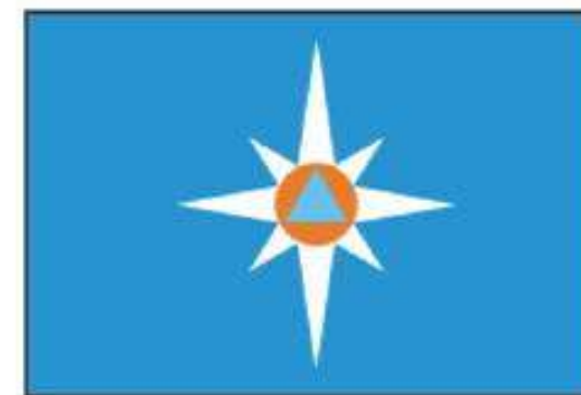
Ведомственный флаг МЧС России